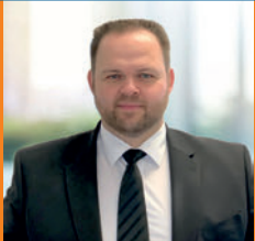
Engin Eroglu Schwalm-Eder